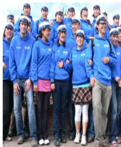
Handelsskolen i Qaqortoq 2010

Men lige så vigtig som skolen er pasningstilbuddene for børnene i førskolealderen. Inatsisartutloven om pædagogisk udviklende dagtilbud til børn i førskolealderen, betyder, at der for hele kommunen kan udarbejdes en samlet plan, der ikke alene tilbyder pasning på daginstitutioner, men også tilbud til førskolebørn i form af forskellige aktiviteter, der skal sikre børnenes udvikling og gøre dem klar til at starte i skolen.