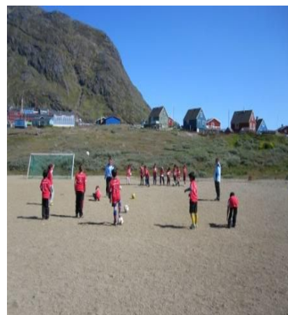
Fodboldskole i Narsaq

Kommunen skal være med til at sikre rammerne om et aktivt kultur- og fritidsliv for såvel børn, unge, voksne som ældre og handicappede.