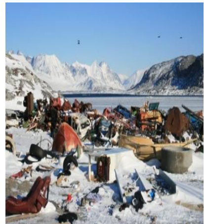
Deponi i Nanortalik