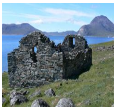
Hvalsø kirkeruin i Østerbygden i Sydgrønland