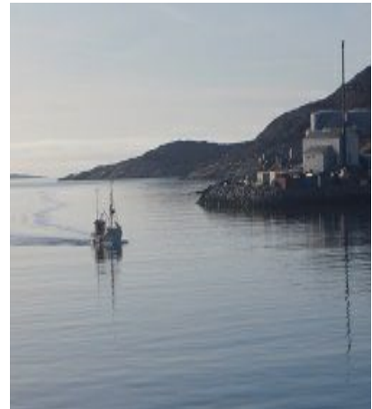
Forbrændings anlæg i Qaqortoq

Bysamfundene Narsaq og Qaqortoq får i dag deres el fra vandkraftværket i i Qorlortorsuaq, og har dermed opfyldt målsætningen om en CO 2 -venlig og stabil el-produktion. Samtidig er der tale om et sammenhængende el-system med en høj grad af forsyningsikkerhed med konventionelle back-up enheder i begge byer. Det arbejdes aktuelt at øge kapaciteten på