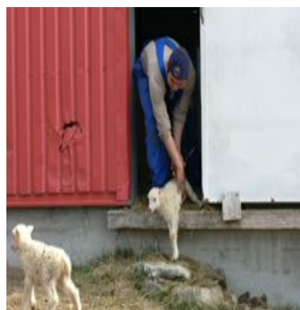
Fåreholdere i Kommunen kujalleq

Kommuneplanen skal således tage højde for de nye erhvervsudviklingsmuligheder, når rammerne for den fremtidige udvikling skal fastlægges.