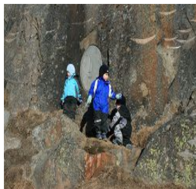
Stensulpturer i Qaqortoq.

Byer og bygder i Sydgrønland rummer også mange bevaringsværdige kulturmiljøer. I de fleste byer og bygder findes der bygninger fra deres grundlæggelse og frem til i dag. Byer og bygder udgør således kulturmiljøer, der fortæller vores historie og derfor bør bevares.