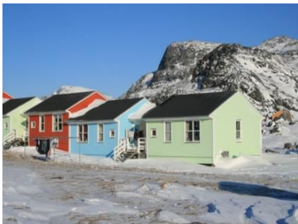
Isafjordur - Nanortalik