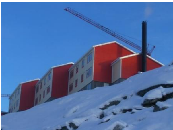
Sivinganikasia i Qaqortoq

For at kunne foretage en mere præcis planlægning af boligrenovering og nybyggeri, skal der udarbejdes en egentlig boligplan for kommunen.