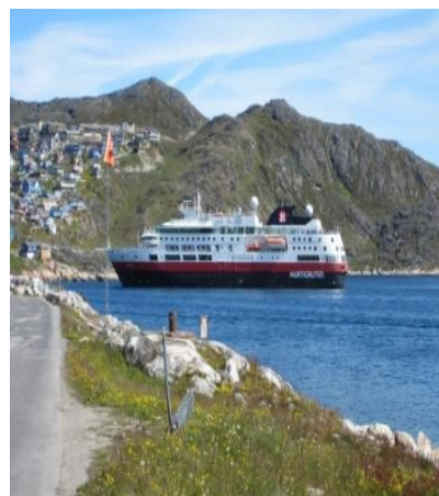
Ankomst til Qaqortoq