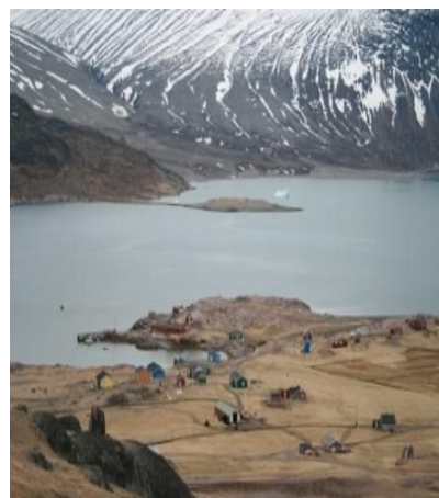
Igaliku, marker og fjeld